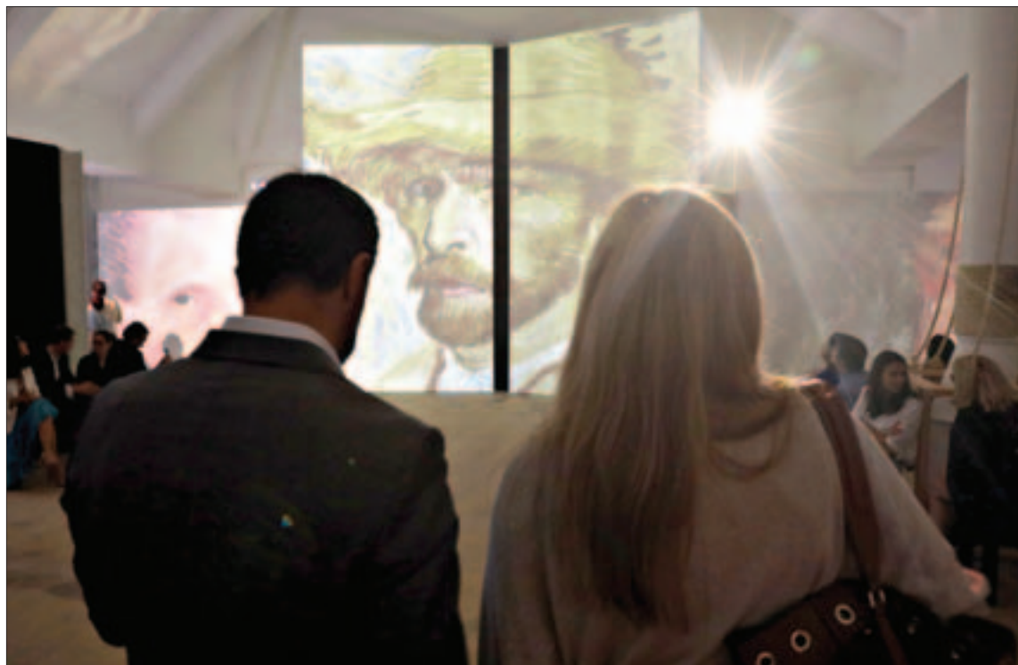
Exposição no Torreão Poente da Cordoaria Nacional, em Lisboa, pode ser visitada até ao fim de agosto

“Além dos visitantes habituais dos museus, esperamos