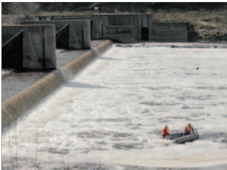
Remoção da espuma que cobriu o rio obrigou à compra de material específico

A remoção dos 30 mil metros cúbicos de sedimentos do rio – entre Vila Velha de Ródão e a barragem do Fratel – obrigou à aquisição de equipamentos específicos como mangas de aspiração com quilómetros de dimensão, material que “não havia”, disse o ministro.