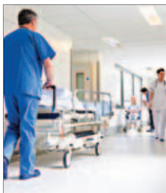
Faltam profissionais na Saúde

saúde e 350 para o Centro Hospitalar do Algarve”. O SEP reivindica “a necessária revisão” dos mapas de pessoal para a admissão de 150 enfermeiros nos centros de saúde no Algarve e denuncia o atraso no pagamento de mais de 1000 horas e 10 mil euros de trabalho extraordinário aos enfermeiros da Unidade de Desabituação do Algarve”. ● R.D.