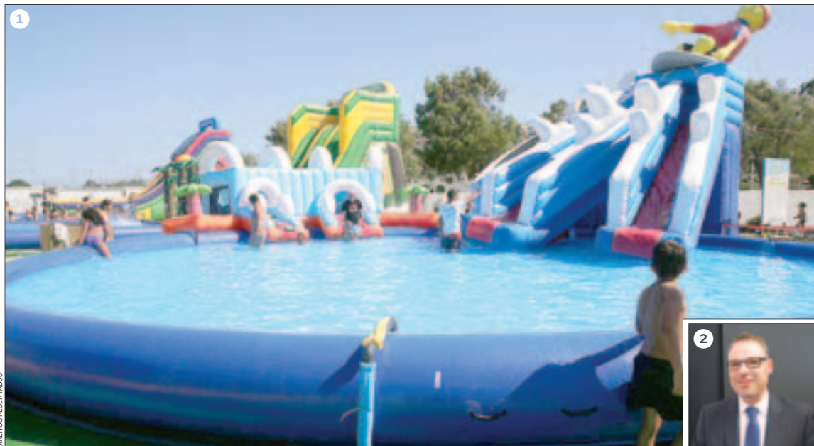
1 Parque aquático Splash Seixal funciona junto à Estação Fluvial do Seixal desde 2017 2 Joaquim Santos, autarca, diz que o espaço de diversões é porta de entrada no concelho

O parque aquático situado junto à Estação Fluvial da Transtejo, no Seixal, começou a funcionar em 2017, numa parceria com a Cofina, proprietária do Correio da Manhã e CMTV . Funciona todos os dias das